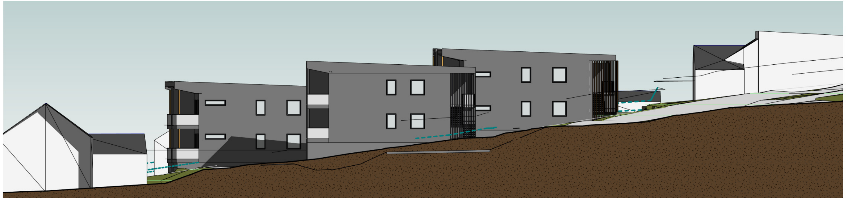
Fasade mot Hammerseng veg 1 : 200